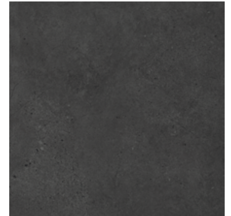
Grafite Clássico ▪ Código 279