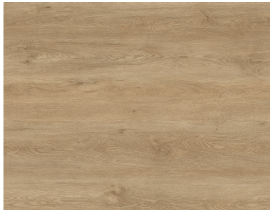
SPC Canela ▪ Código 919

225 x 1200 mm | ESPESSURA 4 mm | CAPA DE USO 0,3 mm | USO RESIDENCIAL E COMERCIAL LEVE