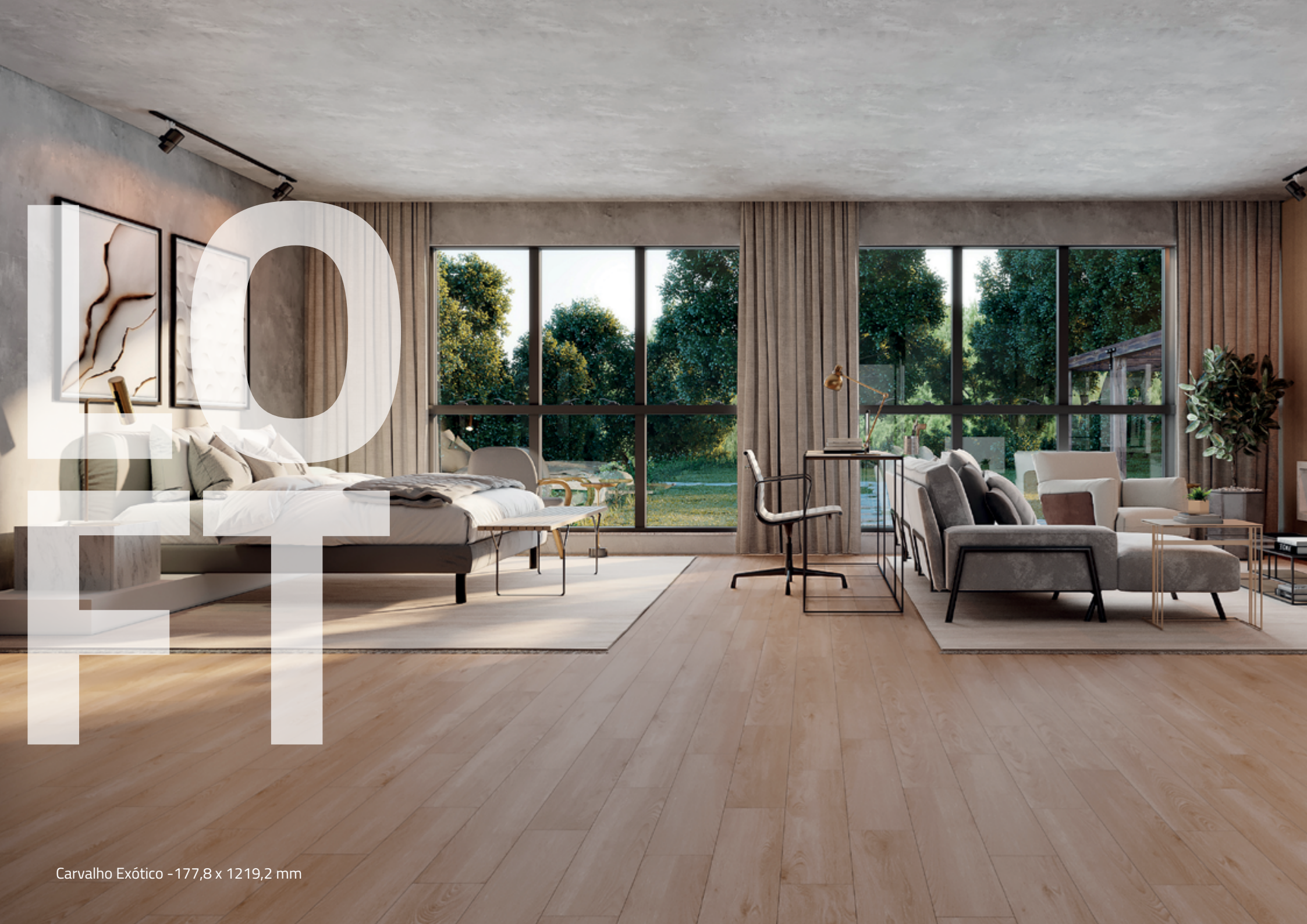
Carvalho Exótico - 177,8 x 1219,2 mm