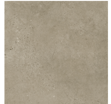
Sêpia Claro ▪ Código 281

914,4 x 914,4 mm | ESPESSURA 3 mm | CAPA DE USO 0,5 mm | USO RESIDENCIAL E COMERCIAL | ALTO TRÁFEGO