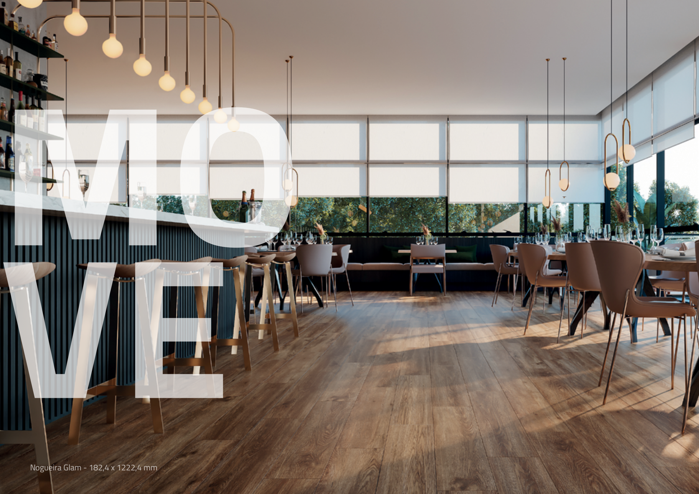
Nogueira Glam - 182,4 x 1222,4 mm