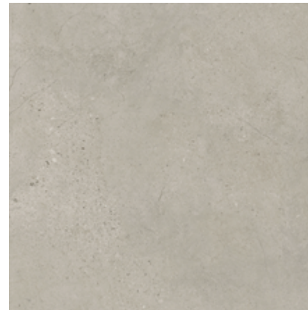
Branco Gelo ▪ Código 280