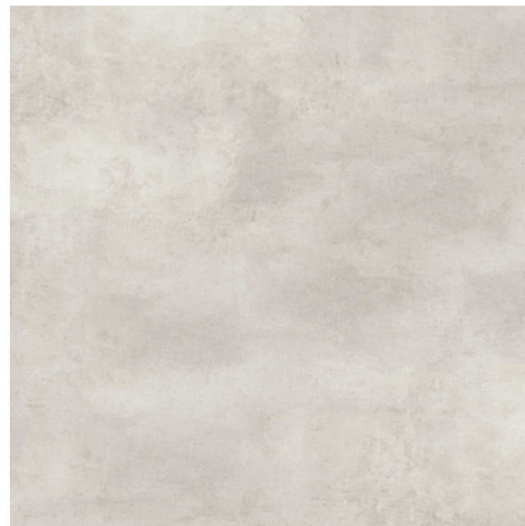
Cimento Claro ■ Código 920

914,4 x 914,4 mm | ESPESSURA 2 mm | CAPA DE USO 0,3 mm | USO RESIDENCIAL E COMERCIAL | MÉDIO TRÁFEGO