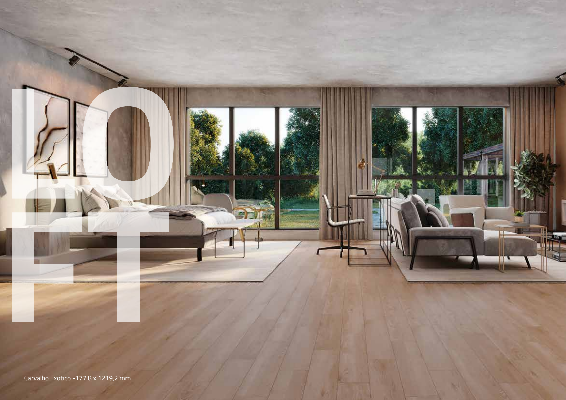
Carvalho Exótico - 177,8 x 1219,2 mm