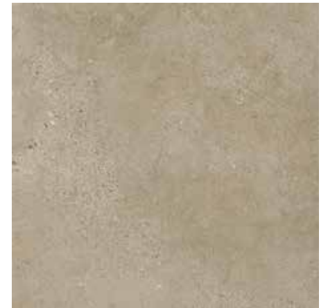
Sépia Claro ▪ Código 281

914,4 x 914,4 mm | ESPESSURA 3 mm | CAPA DE USO 0,5 mm | USO RESIDENCIAL E COMERCIAL | ALTO TRÁFEGO