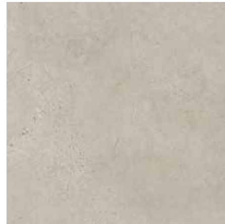
Branco Gelo ▪ Código 280