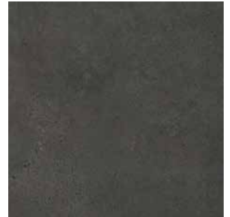
Grafite Clássico ▪ Código 279